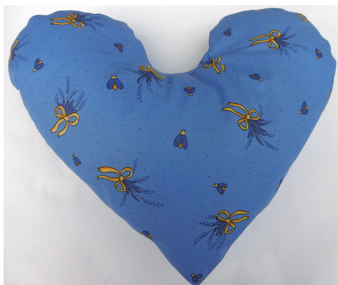
Herz für jede Gelegenheit