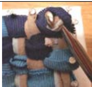
6.Randschleife durchziehen = eine Schlaufe.