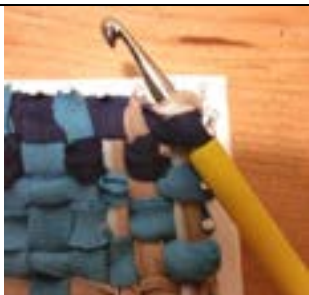
5.Zwei Schlingen in einer Ecke auffassen.