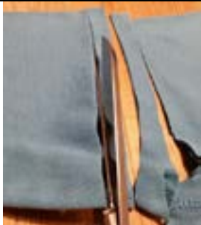
1.Stoffringe schneiden: in 2 cm breite Stoffringe