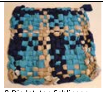
8.Die letzten Schlingen verknoten oder die letzte hochziehen, festnähen.