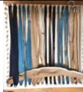
3.Stoffring durchweben: Zweiten Schlinge einhängen, im Wechsel über/unter den Stoffringen durchweben.