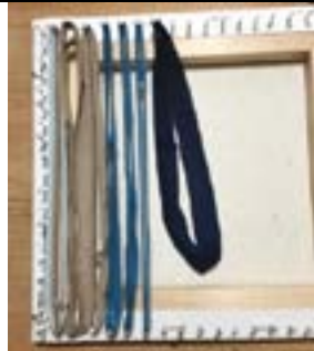
2.Stoffringe senkrecht spannen: eine Schlinge (= zwei Stoffstreifen) bildet einen Kettfaden!