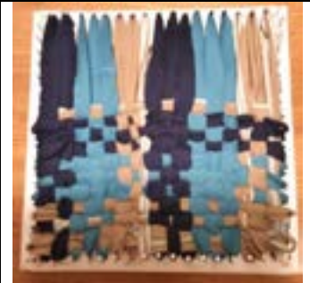
4.Fläche weben: Zweiten und weitere Stoffringe durchweben, einmal oben, dann unten beginnen.