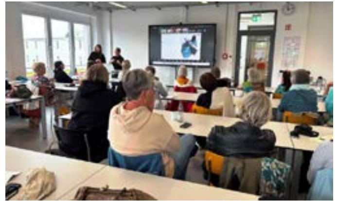
Campusrundgang an der Hochschule Hof/Campus Münchenberg