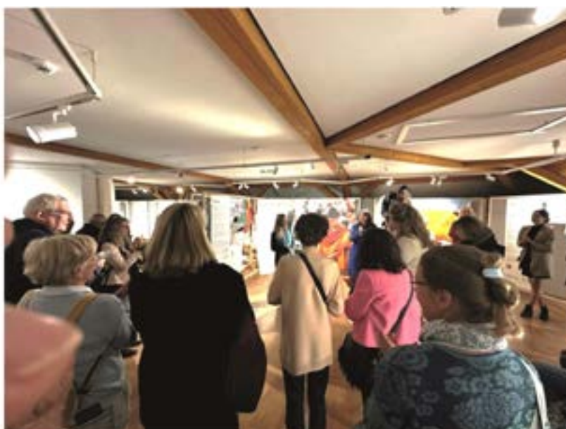
Der erste Tag der Bundesfachtagung klang gemütlich aus.