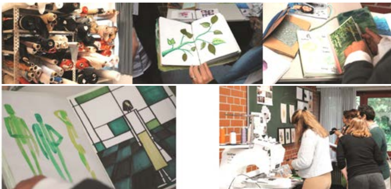
Eröffnung der Ausstellung im Textilmuseum Helmbrechts „Stoffgeschichten – über global bewegte Materialien“