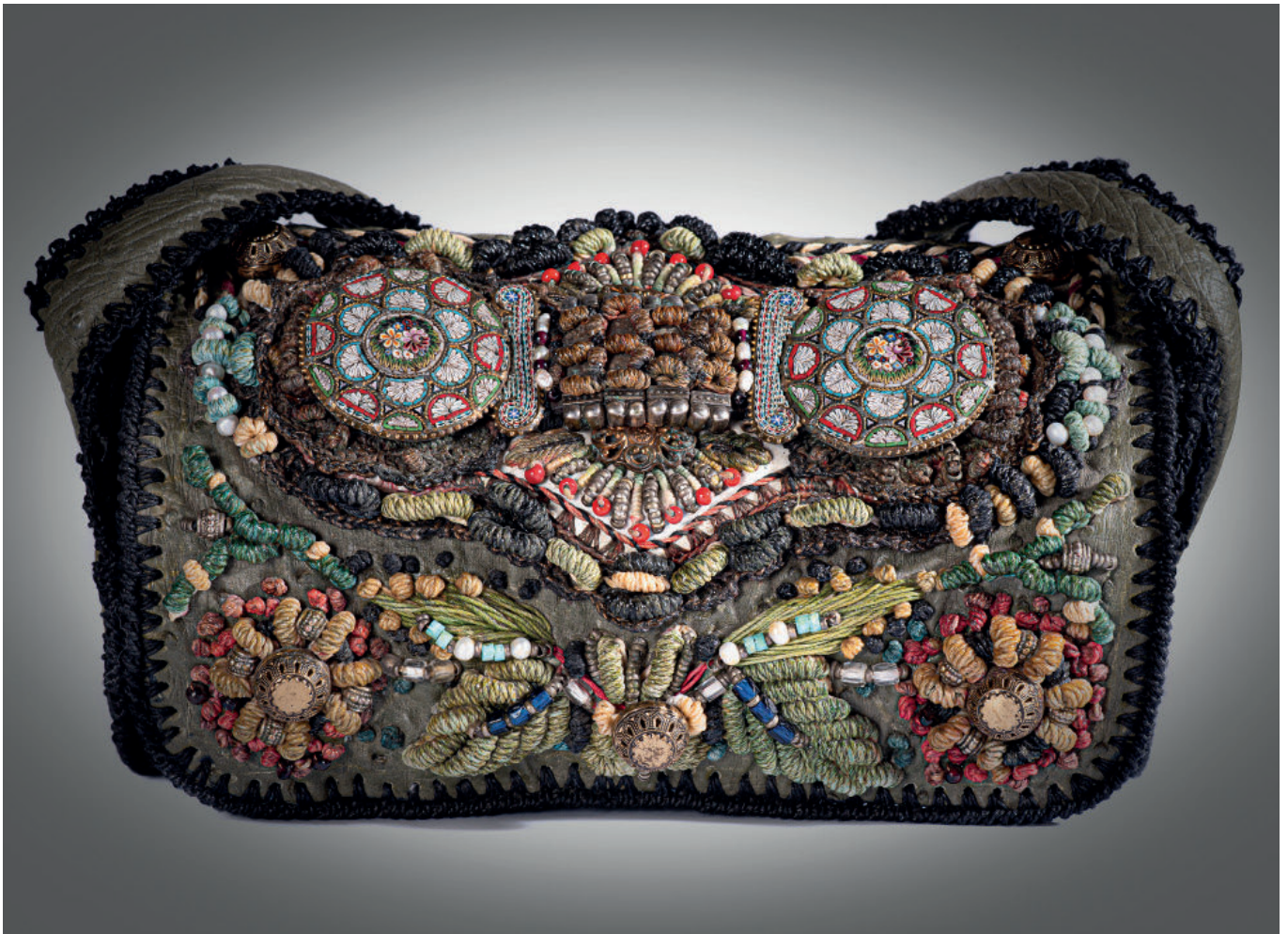
Tasche mit Millefiorischließe zwischen farbiger Flachsstickerei, Glas- und Metallperlen