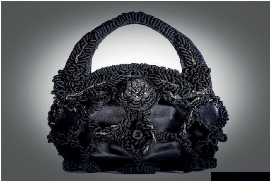
Bügeltasche aus Lederkreisen, die von dichter Stickerei geformt werden