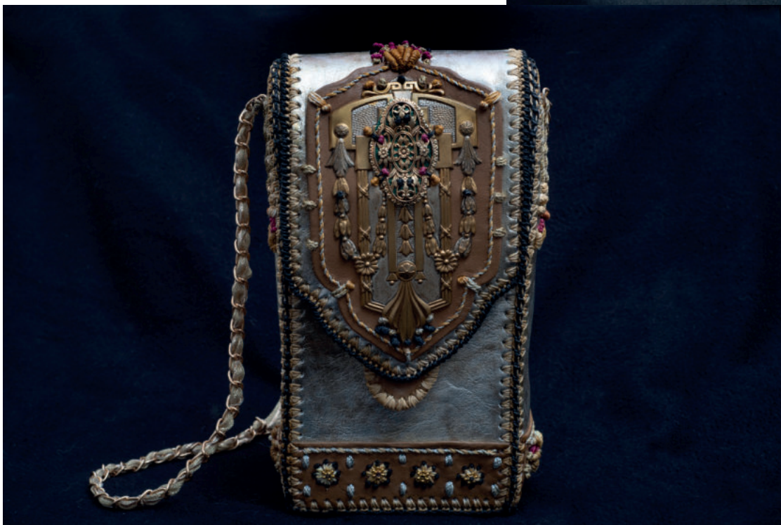
Abendtasche im Jugendstil-Look