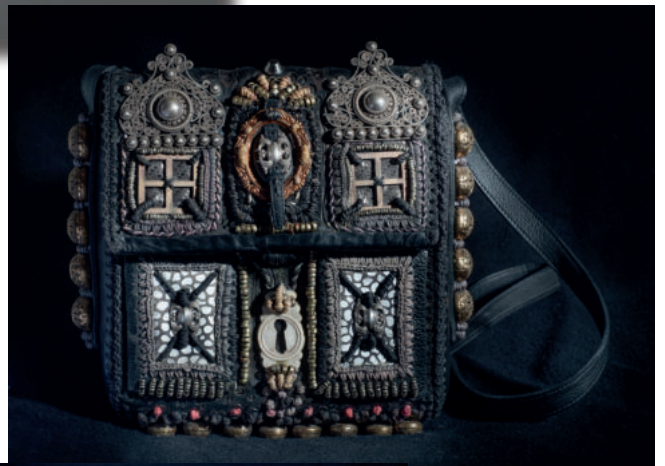
Schultertasche mit exotischen Filigranbeschlägen