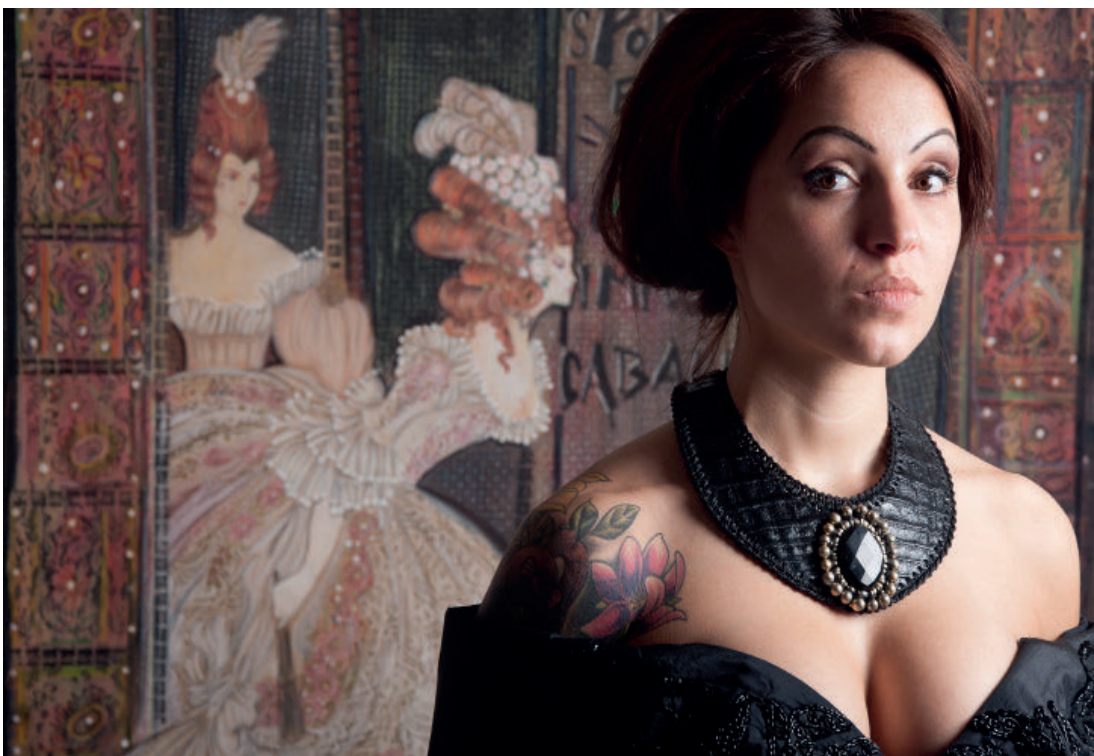
Ledercollier vor Kostümgemälde, beides von Lova Rimini