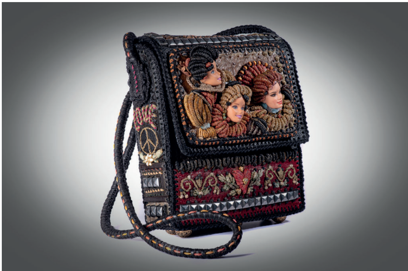
Barbie-Puppengesichter farblich umstickt auf „Love and Peace“-Handtasche

Taschenflanke herauswächst. Oder es wartet auf der Vorderklappe ein ziseliertes Blechbeschlag mit Schlüsselloch auf den passenden Schlüssel, während der moderne Verschluss darunter verborgen bleibt.