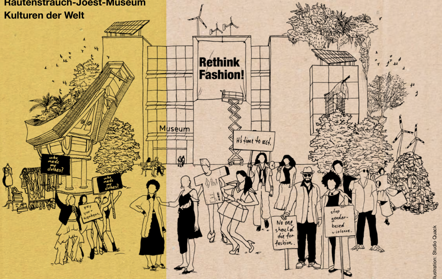
Illustration: Studio Quack

Rautenstrauch-Joest-Museum Kulturen der Welt