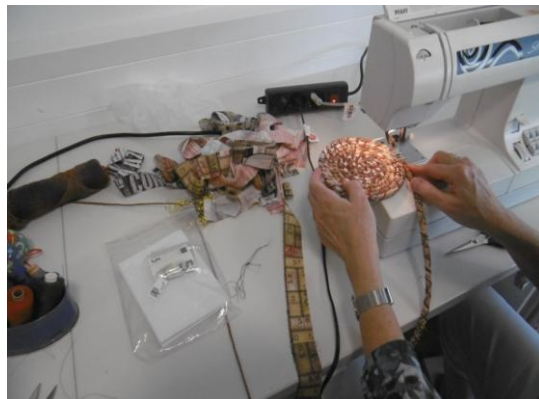
Nähen und Drehen an der Nähmaschine