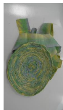
Erst wird die Bodenfläche gearbeitet, dann erfolgt die Formgebung zu einem Korb, rund oder oval.

Fortbildung: Farben mischen? Farben mischen! am 11.11.2017/Referentin Claudia Söllner