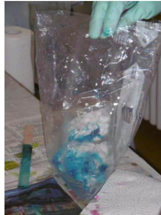
Färben in der Tüte