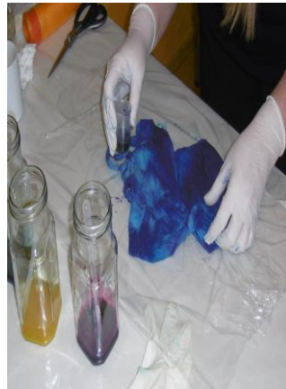
Der Farbstoff wird mit Wasser angerührt u. direkt aufgetragen