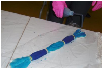
Färben mit Reservierungen