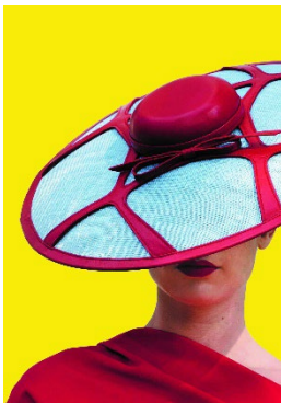
Irene van Vugt, Utrecht, 2019 Leder, Sinamaygewebe © Irene van Vugt

Um 12.00 Uhr sind wir im Cafe und Restaurant MUSEUM, des Bayerischen Nationalmuseums Prinzregentenstraße. 3 angemeldet.